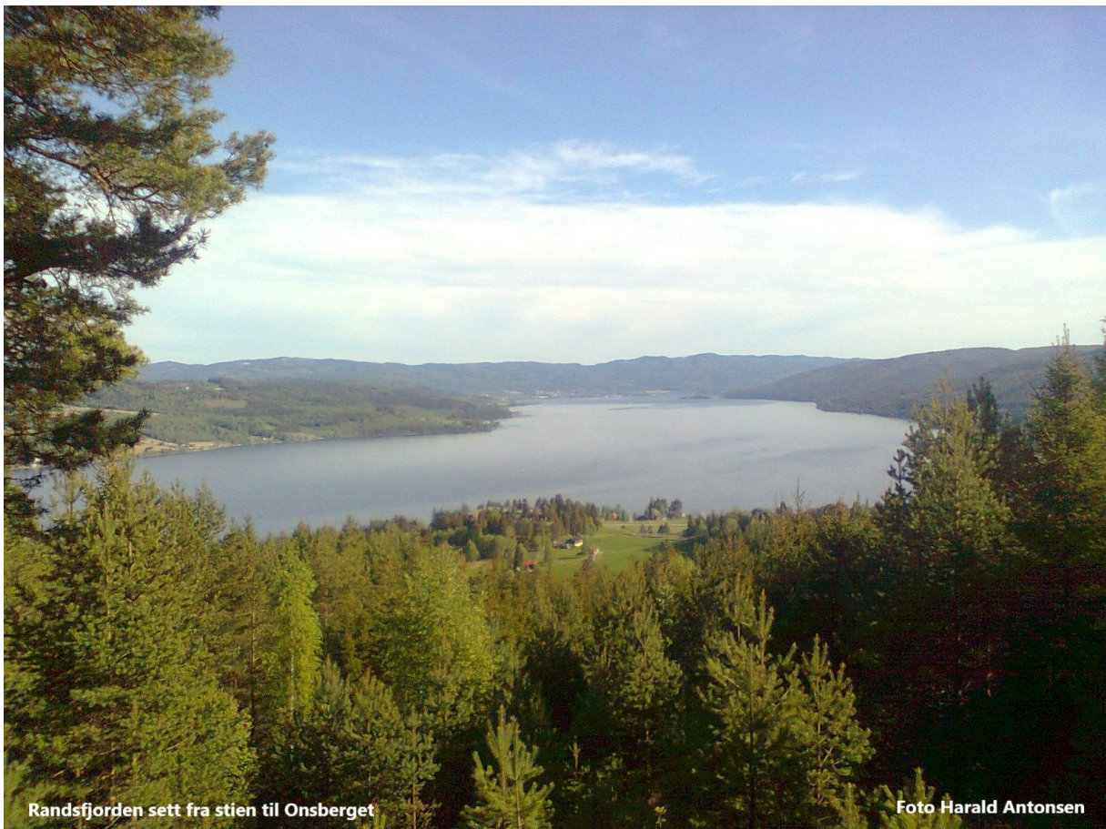
Randsfjorden sett fra stien til Onsberget