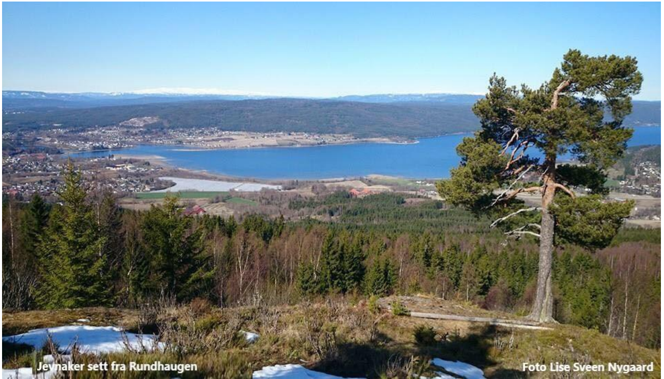
Jevnaker sett fra Rundhaugen