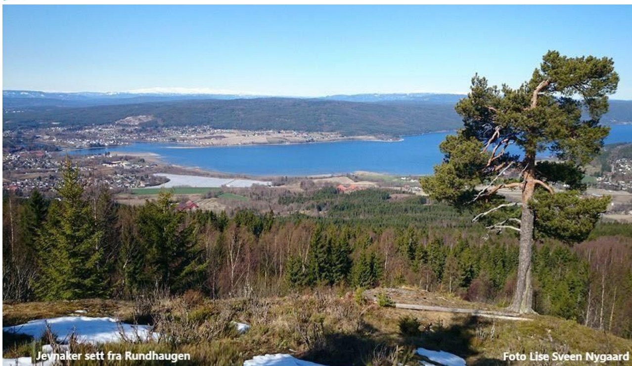
Jevnaker sett fra Rundhaugen