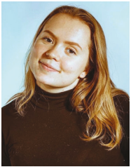
31. KANDIDAT Raket Sjøstad Sørhaug Bryggja