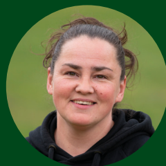
Silje Åsnes Skarstein