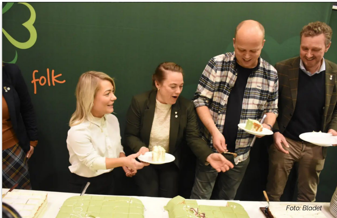
Staten / Statskog sitt kjøp av Meraker Brug feires med kake.