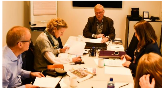
Programkomiteen har hatt jevnlige møter og jobba godt