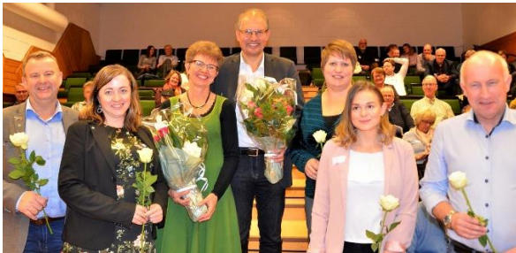
Sju av topp ti til fylkestingslista Vestfold og Telemark Sp