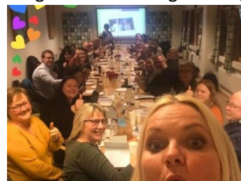
Politikk er gøy! – og gøy å lære!