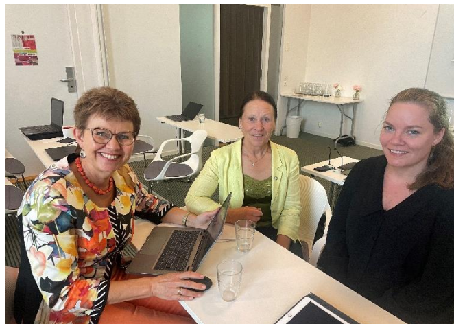
SpS sin delegasjon til lederforum og årsmøte i FNV i2023