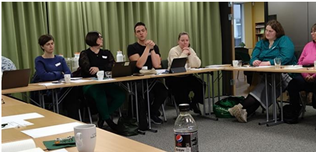
Gruppearbeid under årets samling for fylkesstudieledere.