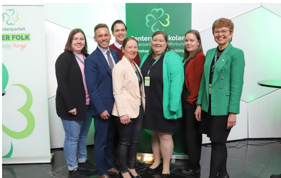
SpS styre og ansatte på Senterpartiets landsmøte i Trondheim, 17-19 mars 2023.

SpS bruker Senterpartiets nyhetsbrev og øvrige informasjonskanaler aktivt for å nå ut med informasjon, men har i 2023 basert mye av informasjonen på e-post til lokallagene. E-postene sendes til leder, studieleder og kasserer, av og til gruppeledere og en sjelden gang også til hele styret. Dette har gitt bedre kontakt, da vi opplever at flere gir tilbakemelding og stiller spørsmål både pr telefon og e-post. SpS har egen Facebookside, og arbeider kontinuerlig med å få medlemmer og tillitsvalgte i medlemsorganisasjonene til å bli enda mer bevisst på hvilke muligheter som ligger i studieaktivitet og kompetansebygging. Det jobbes jevnlig med dette på seminarer, møter, gjennom kontakt med fylkesledere, fylkessekretærer fylkesstudieledere, lokallag og gruppeledere i kommunestyrene. Det jobbes dessuten kontinuerlig med informasjonsspredning og synlighet gjennom utsending av informasjonsmateriell, brosjyrer, nettpublisering og e-post. Senterpartiet har i 2023 hatt to ansatte lagbyggere, som reiser ut og besøker lokallag. Dette sparer SpS for ressurser, noe som har gitt mulighet for å rette innsatsen mer mot digital deltakelse og webinarer.